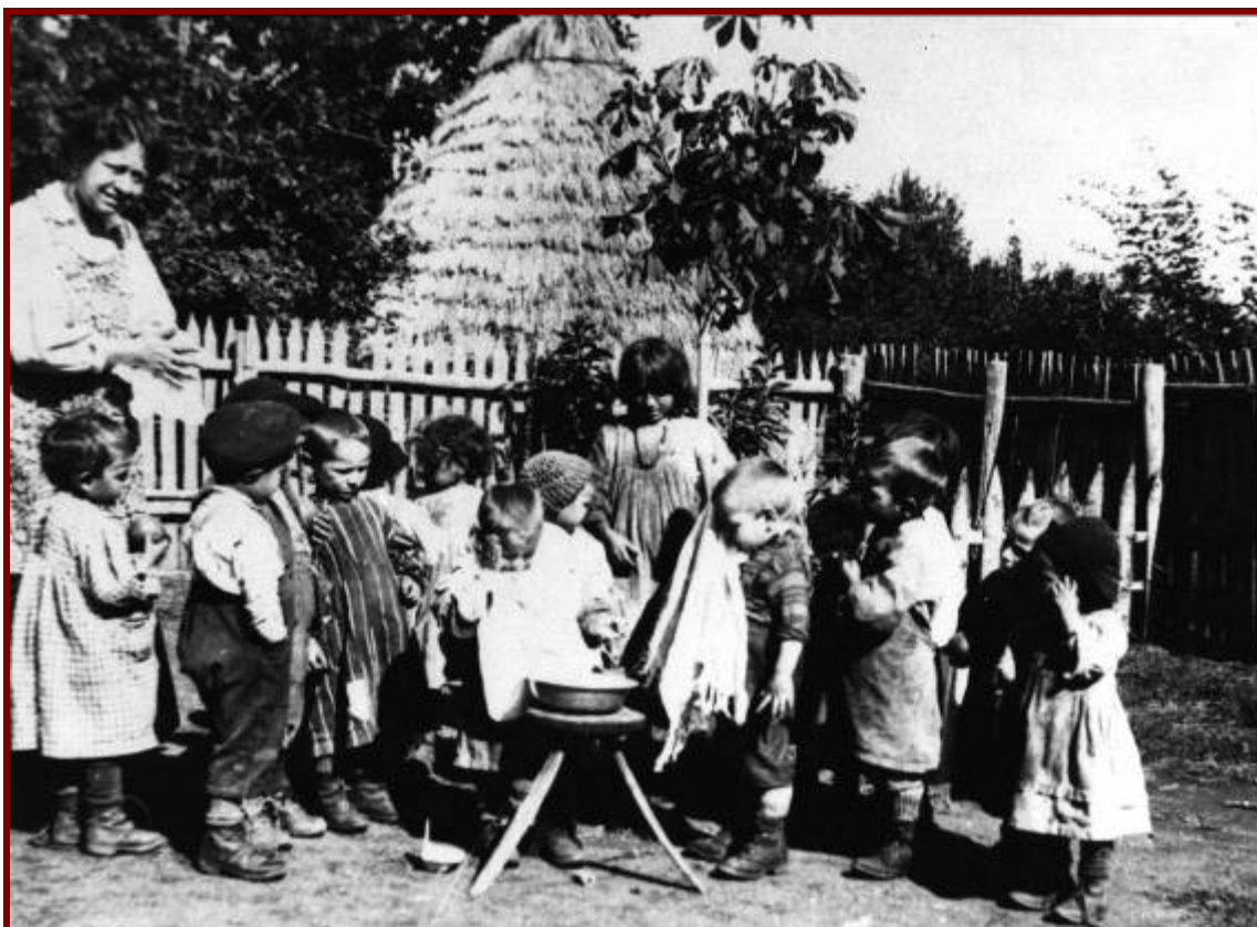
La pulizia quotidiana dei piccoli della scuola di Colle di Fuori – inizi del '900