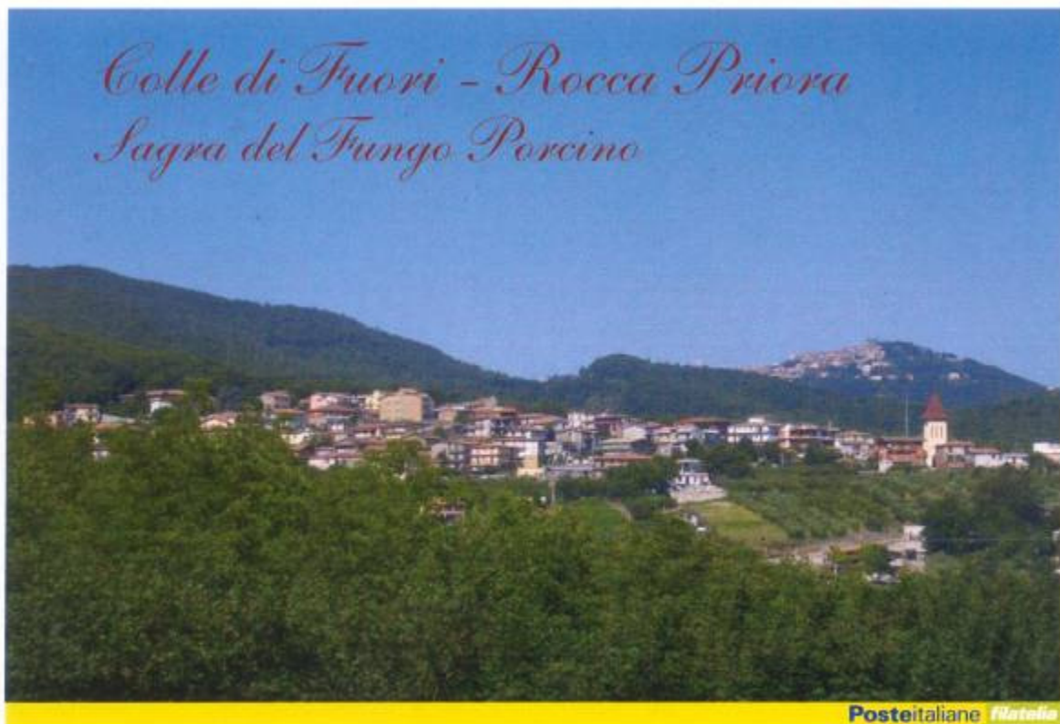
Poste Italiane: affrancatura speciale per Colle di Fuori

In sintesi il compito è quello di valorizzare al massimo le attitudini e le vocazioni della popolazione, ricercando un rapporto non meramente speculativo con il proprio territorio, aprendo l'orizzonte a tematiche nuove ed emergenti, ecocompatibili ed economicamente promettenti, senza perdere il filo di un discorso identitario, riflesso nell'azione sociale e culturale che intende promuovere e stimolare il progetto, creando le condizioni per un rinnovamento ed un confronto non subordinato con altre esperienze similari condotte in ambito nazionale e comunitario.